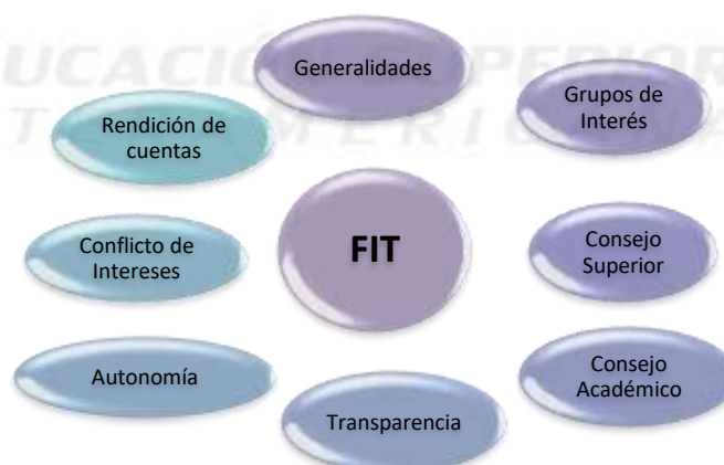
Ilustración 1. Lineamientos de buen gobierno en la FIT

Basados en lo anteriormente enunciado, la FIT, se acoge a los lineamientos relacionados con el Buen Gobierno en las Instituciones de Educación Superior, planteados en el Acuerdo No. 02 de 2017 del Consejo Nacional de Educación Superior – CESU., para la implementación de su Código de Prácticas de Buen Gobierno, tomando como sus pilares, los relacionados a continuación: